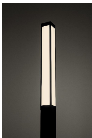
ソーラーLEDポールライト ルメナイト 電球色 (2700K)

フクビ化学工業株式会社は、電源不要のスタイリッシュなソーラーLED屋外照明灯「ルメナイト」「ラヨビア」のラインナップに、従来の白色に加え、空間に温かみをもたらす「電球色」を追加し新たに発売します。さらに、アプローチライトタイプの「ラヨビア」向けにコンクリートの打設作業を不要にする「ラヨビア用乾式基礎」を同時発売します。