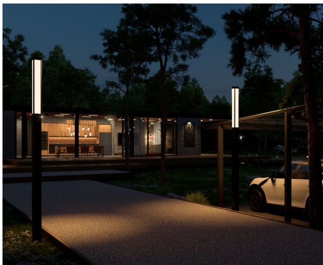
ソーラーLEDポールライト ルメナイト 電球色 (2700K) の使用例