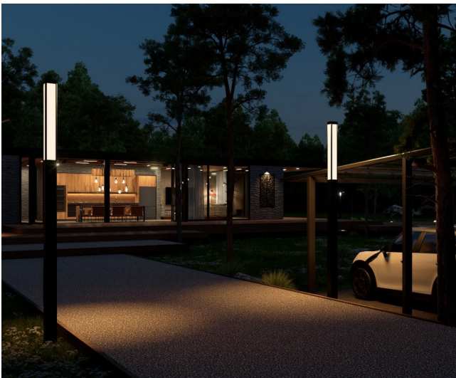
ソーラーLEDポールライト ルメナイト 電球色 (2700K) の使用例