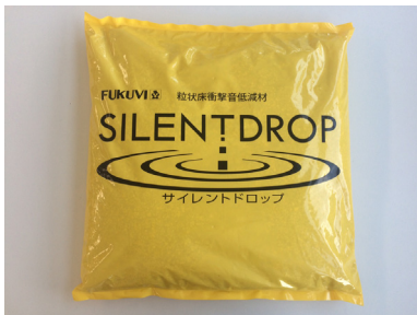
サイレントドロップ製品写真