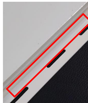
変更後（軟質：ホワイト）