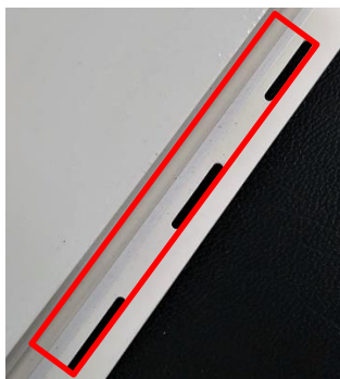
既存品（軟質：ゾウゲ）